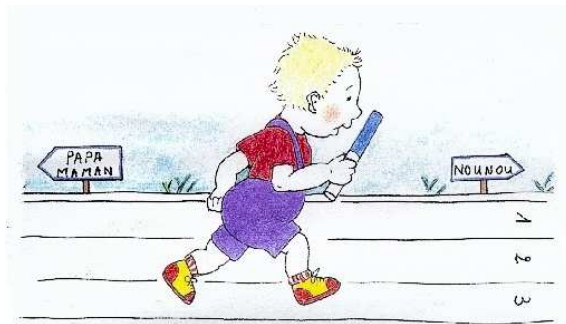
Relais Assistantes Maternelles Parents Enfants